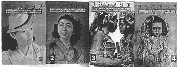
図1 『フジンアジア』1～4号表紙