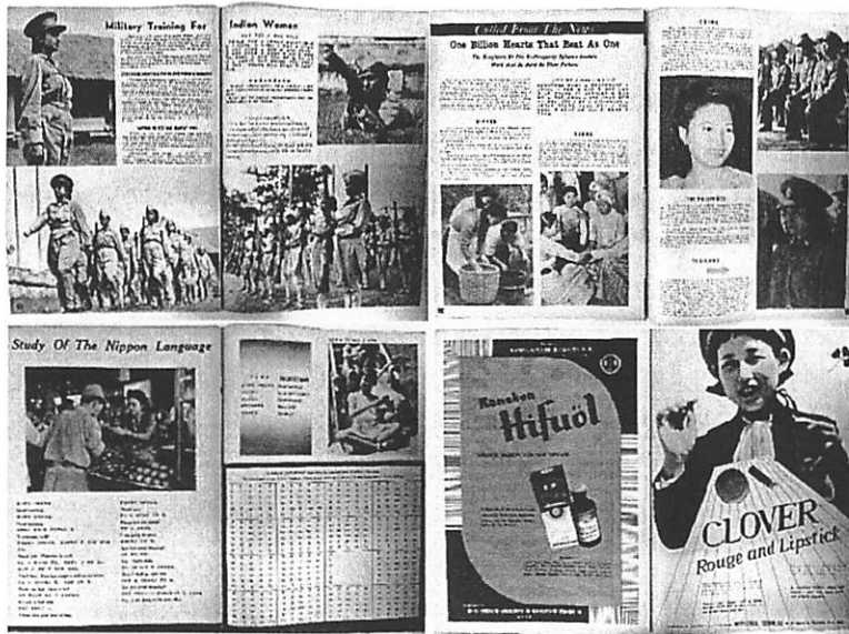
図3 『フジンアジア』記事・広告例

左上：第11号 pp. 18-19 「インド婦人の軍事訓練」 右上：第12号 pp. 20-21 「十億の心は一つ」 左下：第11号 pp. 22-23 日本語学習 右下：第11号 pp. 16-17 薬品・化粧品広告